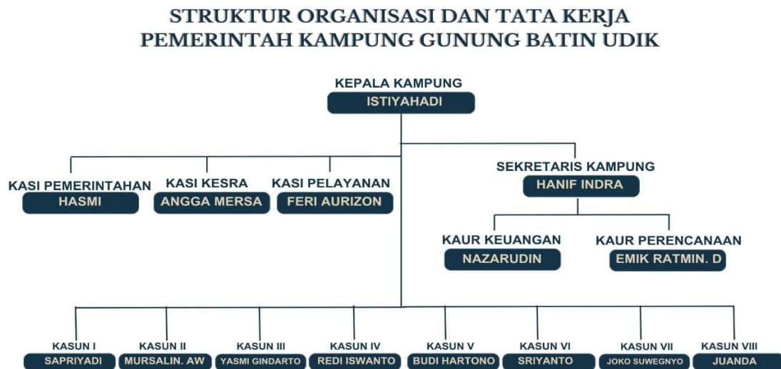
Gambar 2. Struktur Organisasi dan Tata Kerja Pemerintah Kampung Gunung Batin Udik Tahun 2023